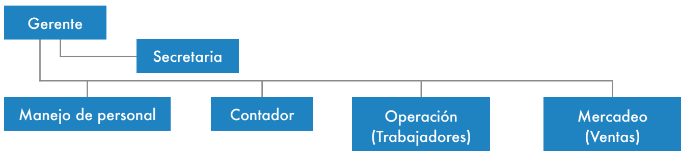
Figura 1. Ejemplo del modelo organizativo de una famiempresa

A continuación se encuentra un modelo gráfico de la organización de una empresa, de manera tal que podremos evidenciar lo sencillo del modelo, comprobando la necesidad de una autogestión más responsable y más organizada.