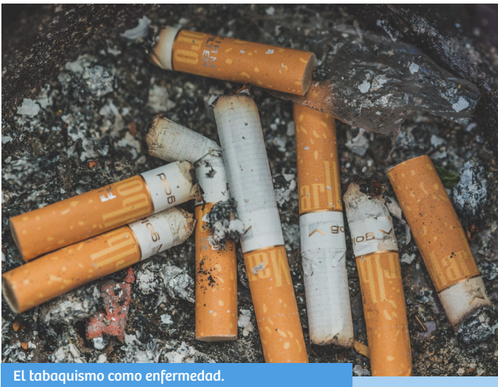
El tabaquismo como enfermedad.

Es importante mencionar que no solo los fumadores tienen alto riesgo de padecer enfermedades crónicas degenerativas por el tabaquismo, ya que los fumadores pasivos también corren un gran riesgo. Para este, inhalar el humo del cigarro causa daños inmediatos debido a su alto contenido tóxico, ya que contiene tres veces más nicotina y alquitrán y cinco veces más monóxido de carbono que la “Corriente principal”, aspirada por el fumador directo. Así, se estima que inhalar el humo del cigarro por una hora equivale a fumar de 2 a 3 cigarrillos.