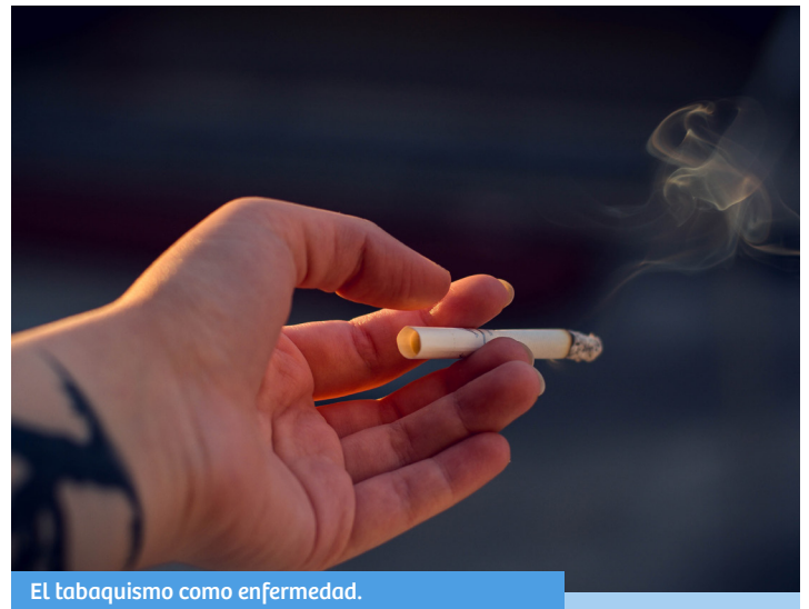
El tabaquismo como enfermedad.