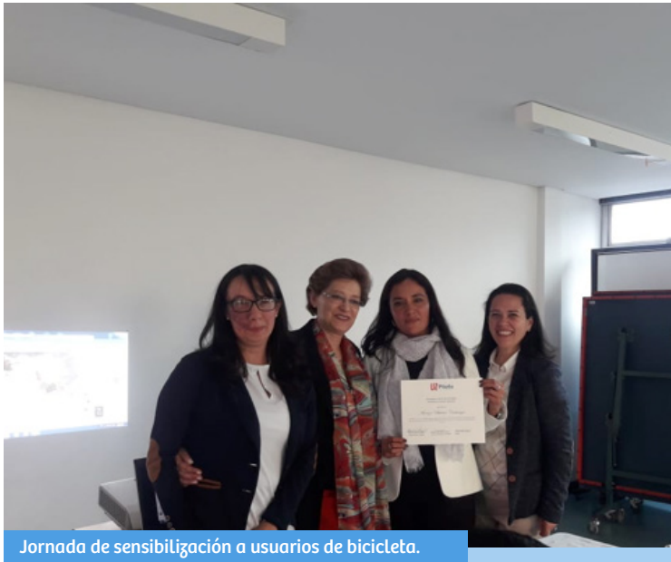
Jornada de sensibilización a usuarios de bicicleta.

Dando cumplimiento al programa de Educación inclusiva, liderado por el Área de Promoción y Desarrollo del Departamento de Bienestar Institucional y desarrollado en las instalaciones de la Universidad Piloto de Colombia, en el pasado mes de junio se llevó a cabo el proceso de formación de Lengua de señas a docentes de las áreas comunes de Humanidades, Informática y Medio Ambiente y Sostenibilidad.