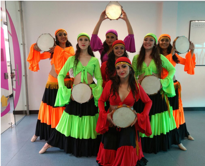
Grupo representativo de Danza árabe, Universidad Piloto de Colombia.

De las presentaciones realizadas por los grupos de Danza árabe, Danza folclórica, Danza urbana y Música folclórica en el marco de la Semana Piloto de la Identidad es importante resaltar los siguientes resultados: la plasticidad, la belleza de los colores, la destreza física y los sonidos que se hicieron presentes. También es importante destacar el nivel excelente de valores artísticos y la disciplina de los grupos de estudiantes y funcionarios, quienes con sus aplausos gratificaron a los artistas que deleitaron con su quehacer.