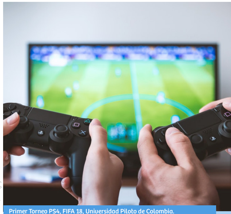
Primer Torneo PS4, FIFA 18, Universidad Piloto de Colombia.