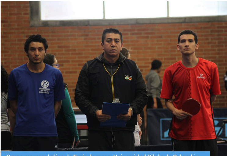
Grupo representativo de Tenis de mesa, Universidad Piloto de Colombia.