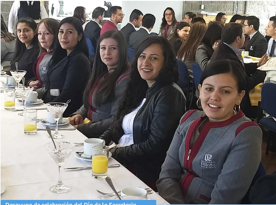
Desayuno de celebración del Día de la Secretaria.

El 25 de abril se llevó a cabo con gran éxito el desayuno de celebración del Día de la Secretaria y Auxiliar de Oficina, con este gesto queremos agradecerles a nuestras colaboradoras y colaboradores la labor que con gran empeño, lealtad, abnegación y diligencia realizan día a día. Sin duda, estas virtudes caracterizan a las secretarías de la Universidad Piloto de Colombia.