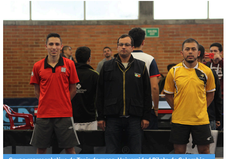
Grupo representativo de Tenis de mesa, Universidad Piloto de Colombia.