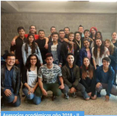
Asesorías académicas año 2018 - II