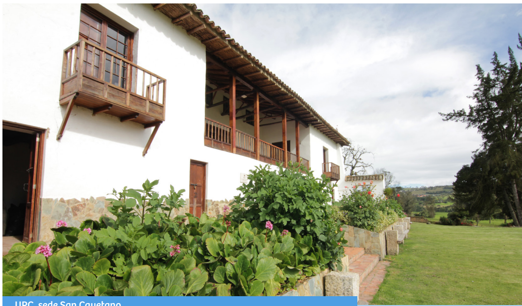
UPC, sede San Cayetano.

Los nuevos estudiantes de pregrado de segundo semestre del 2018 de la Universidad Piloto de Colombia asistieron a la Jornada de Inducción e Integración, que realizó el Departamento de Bienestar en La Sede San Cayetano – La Calera. En dicha jornada se presentaron las áreas, los servicios y el equipo de trabajo del Departamento. Esta jornada contribuye a fortalecer los espacios de integración e identidad Institucional.