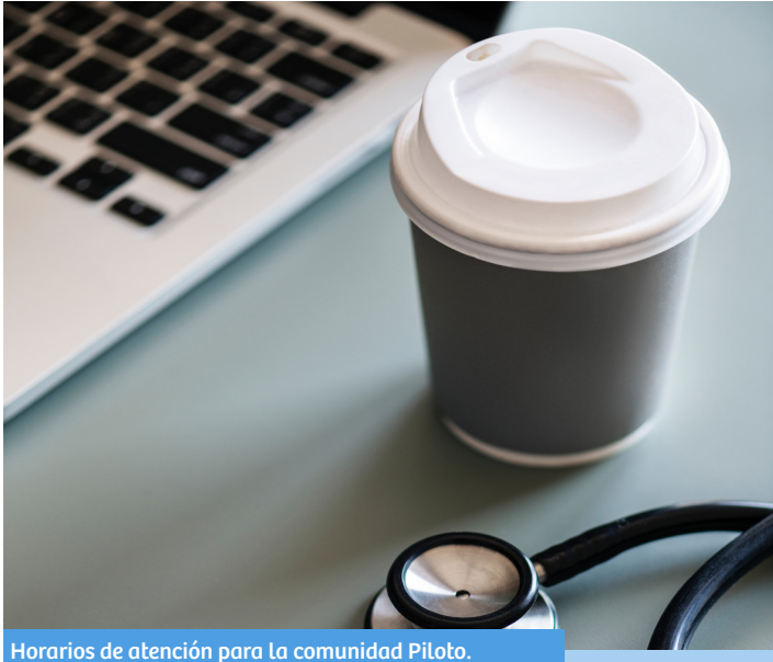
Horarios de atención para la comunidad Piloto.