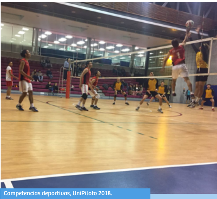
Competencias deportivas, UniPiloto 2018.

Sandoual, R. (2018). Selección UPC vs Universidad Los Andes de voleibol masculino – Torneo ASCÚN. Bogotá, Coliseo Universidad Los Andes. Editorial