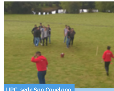
UPC, sede San Cayetano.