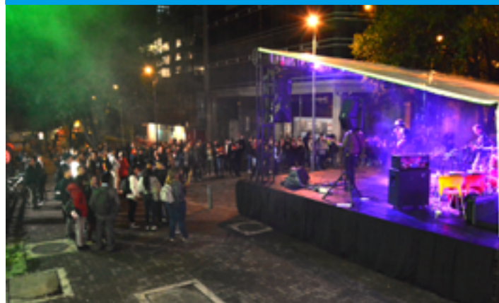
Infame "Tributo a Héroes